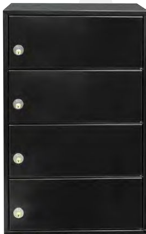
Bagside med postudtag