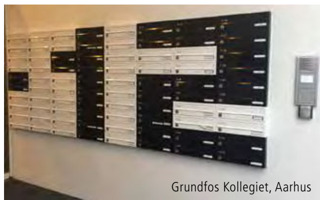
Grundfos Kollegiet, Aarhus