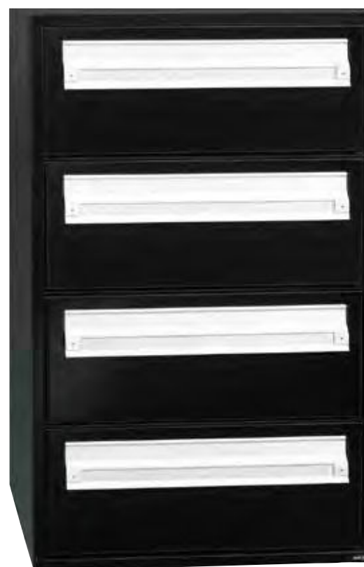
Front med indkast