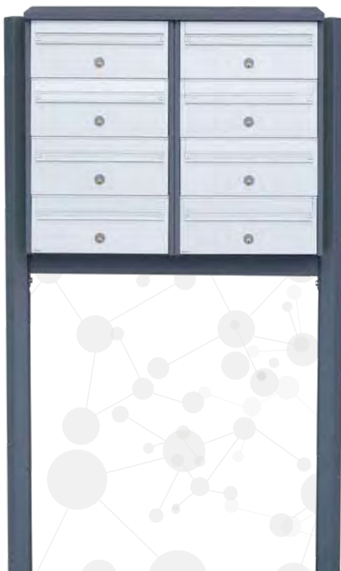
Model 700: Kabinet i hvid RAL 9016 med front i aluminium