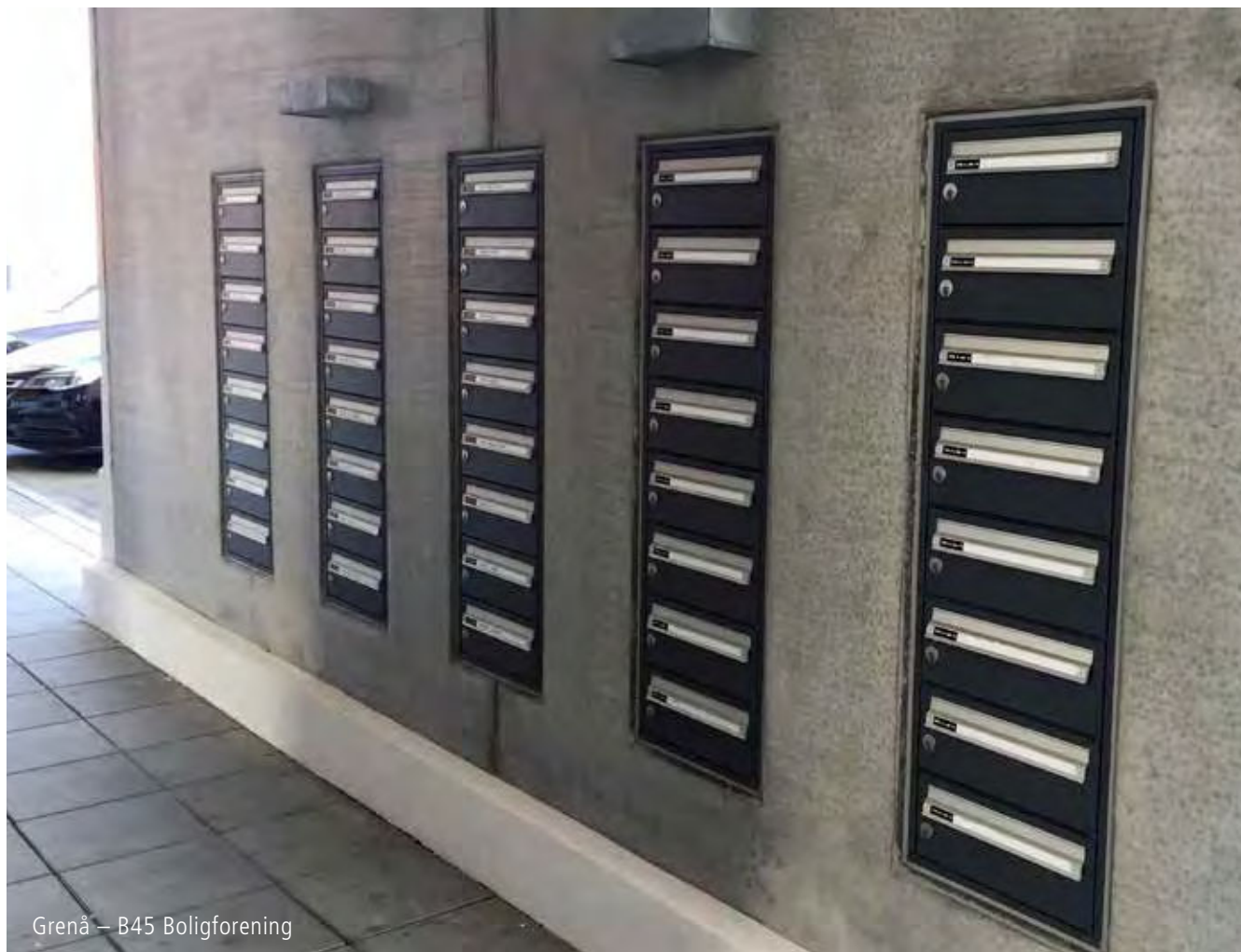
Grenå – B45 Boligforening