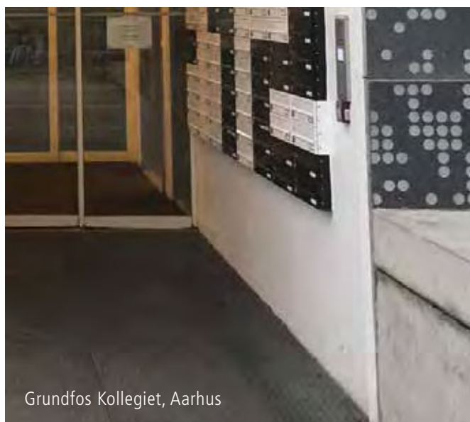
Grundfos Kollegiet, Aarhus