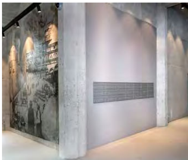
Renz Plan, RAL 9007, The Silo, København